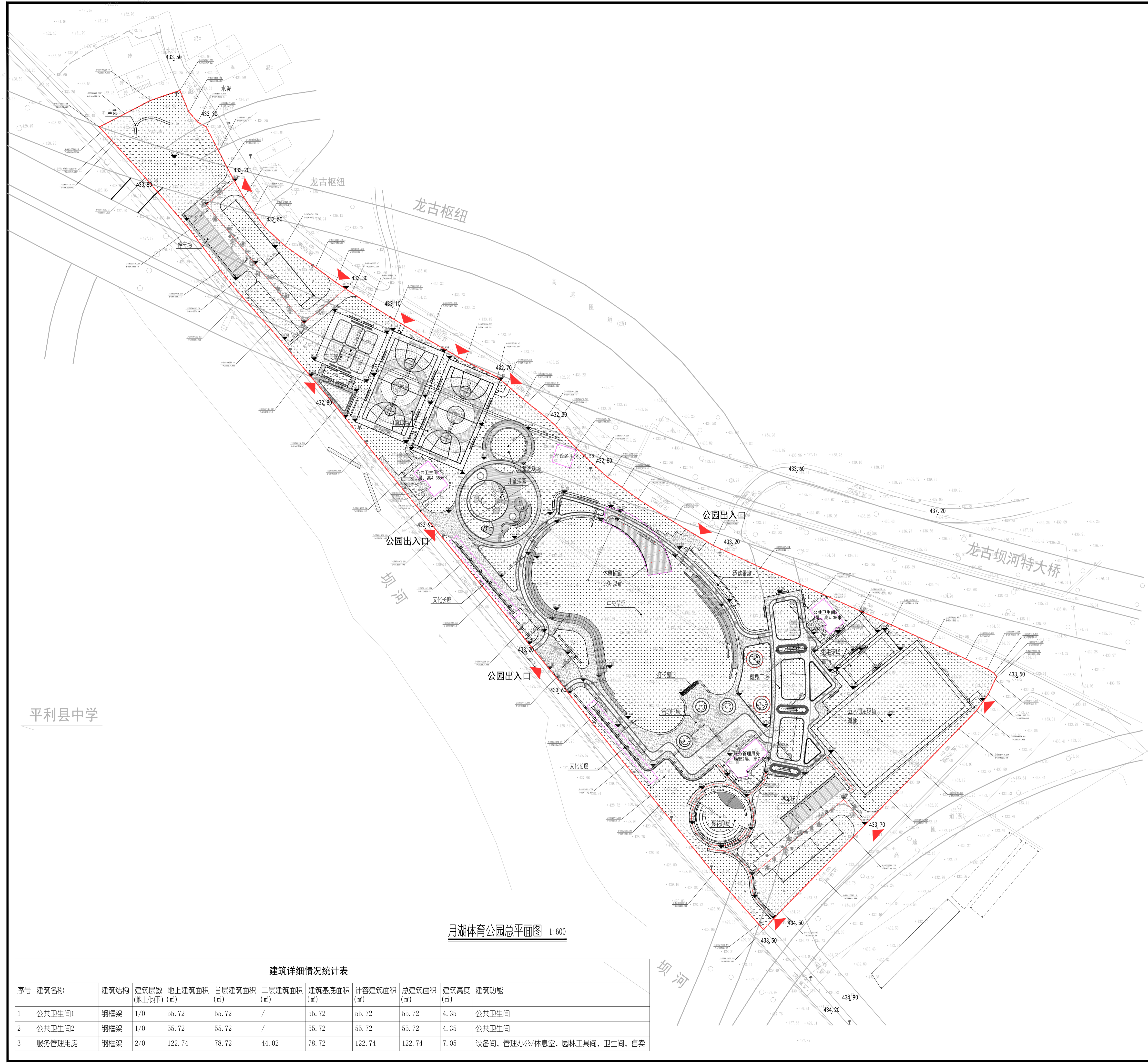
月湖体育公园总平面图 1:600